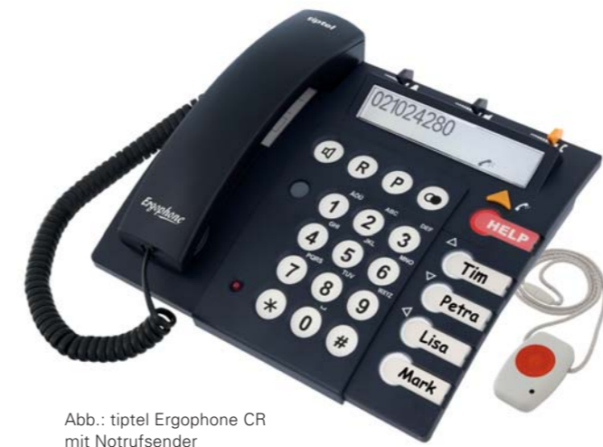
Abb.: tiptel Ergophone CR mit Notrufsender