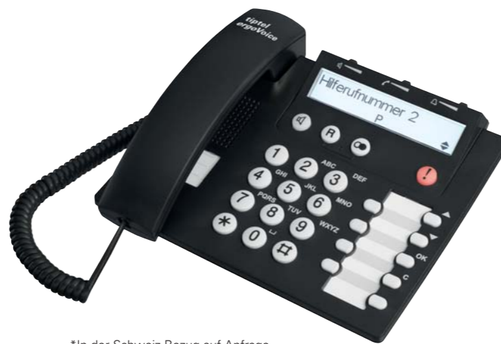
*In der Schweiz Bezug auf Anfrage